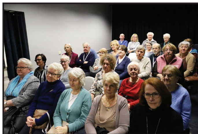
Zalesiański Dzień Seniora