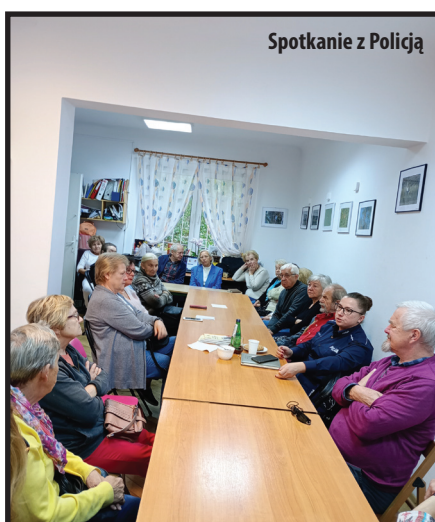
Spotkanie z Policją