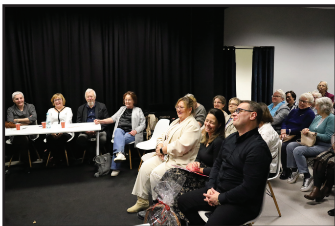
Zalesiański Dzień Seniora