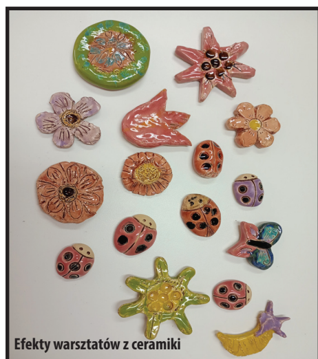
Efekty warsztatów z ceramiki