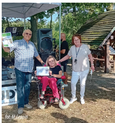
fot. M. Leppin